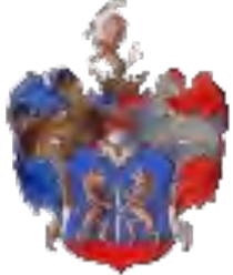
arma Tötössy de Egyházásfalva

Levéltárak: Magyar Országos Levéltár (Tötösy család P 688 1563-1863, 1311 okirat); Soproni Levéltár (Acta Familiae Tötösy 1600-1794, 77 okirat); Tötösy, László (pecsét): "Iuridica Tom. I. fasc. 97. nr. 3615. 1683" (Soproni Megyei Levéltár); Vas Megyei Levéltár (Tötösy 1625-1719, 5 okirat); Zala Megyei Levéltár ("Tötösy Gábor 1619. október 28. 1634. április 6. előtt jegyző"); Fejér Megyei Levéltár (Tötösy 1688-1726, 17 okirat); A Csáky család szepesmindszenti levéltára: Dominium B[D]asztfalu-Tötösy család 1623-1682 (9 okirat); Österreichisches Staatsarchiv-Kriegsarchiv (8 okirat).