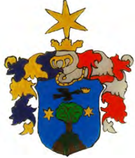
arma Torda de Kisfalud