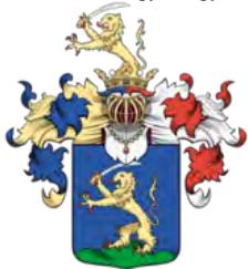
arma Hegedüs de Eör (1)