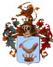
arma Fényes de Csokaly