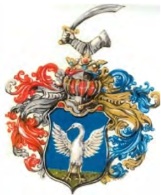
arma Szalay de Eöts