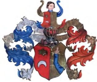
arma Jurenák (2)